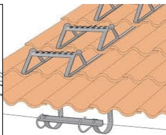
Glidskydd & takstege