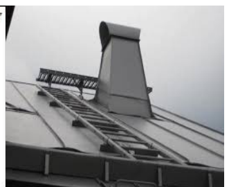
Takstege och takbrygga