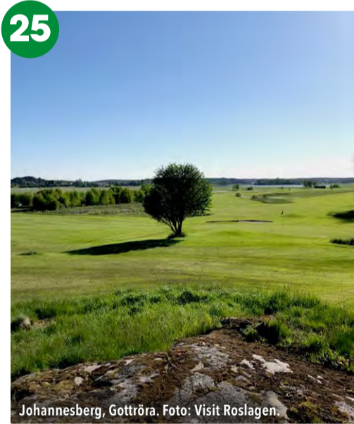
Johannesberg, Gottröra.