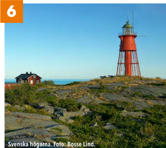
Svenska högarna.