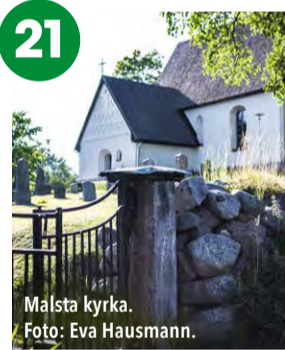
Malsta kyrka.