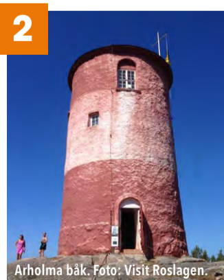
Arholma båk.

Här finns områden som på ett tydligt sätt speglar skärgårdens historia med mångsyssleri. Exempel på detta är hamnlagren med bryggor, kajer och sjöbodar i anslutning till bostads- och ekonomibygnader. Spår av lotsverksamhet, fiske, ängs- och hagmarker visar på skärgårdens ständiga utveckling.