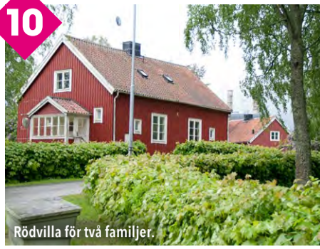
Rödvilla för två familjer.