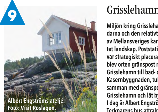
Albert Engströms ateljé.