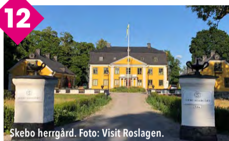
Skebo herrgård.