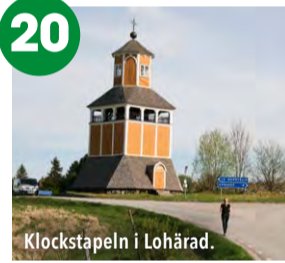
Klockstapel i Lohärad.