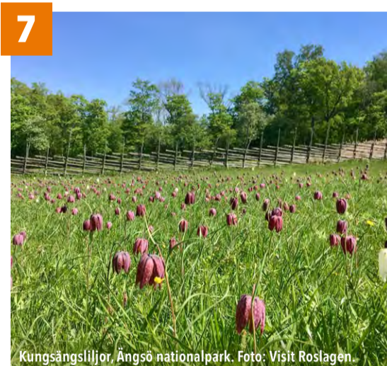
Kungsängslliljor, Ångö nationalpark.