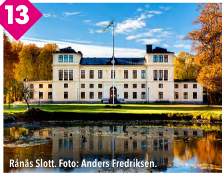
Rånäs Slott.