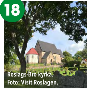
Roslags-Bro kyrka.