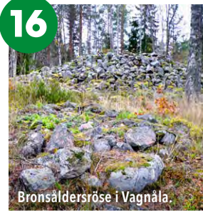
Bronsåldersröse i Vagnåla.