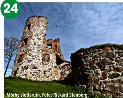
Mörby slottsruin.