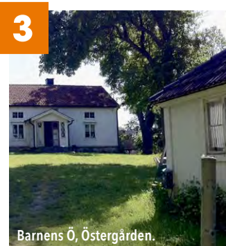
Barnens Ö, Östergården.