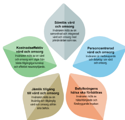
Bild 3. Illustration från Handlingsplan god och nära vård och omsorg 2024–2030 som beskriver de fem övergripande målen för samverkan mellan kommuner och region.

Målet har delats upp i fem målområden som tydliggör vilka förflyttningar som behöver ske utifrån invånarens perspektiv.