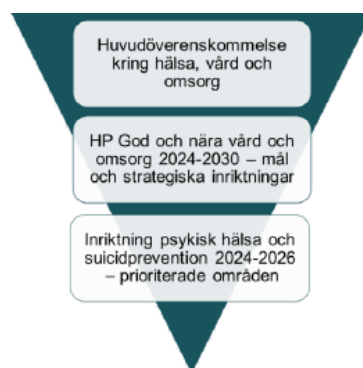
Bild 2. Kopplingen mellan Handlingsplan god och nära vård och omsorg (HÖK) och Inriktning för psykisk hälsa och suicidprevention.

Framtagen Stockholms läns 26 kommuner och region Stockholm, beskriver prioriterade områden inom psykisk hälsa och suicidprevention där stegförlyttningar förväntas göras. Inriktningen är en del av Handlingsplan för god och nära vård och omsorg i Stockholm län.