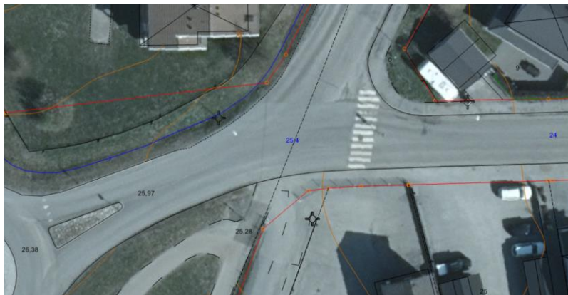
Flygfoto med dagens situation, dock taget innan övergångsstället togs bort.

I gällande detaljplan för Stjärnan 8 och 24 finns utfartsförbud längs med Carl Bondes väg. Fastigheternas utfarter ligger något odefinierade längs de båda fastigheternas hela norra gräns, mot Drottning Kristinas väg men även direkt ut mot korsningen med Bolkavägen. Tidigare fanns ett övergångsställe på platsen (se flygfoto nedan), men det är för närvarande borttaget. (Vissa synpunkter från närboende har inkommit kring borttagandet av övergångsstället.) Övergångsstället, liksom refugen direkt öster om övergångsstället, står delvis i konflikt med fastighetsutfarterna.