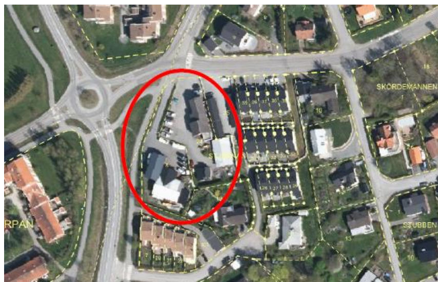
Ortofoto över området.

Området är idag bebyggt med en kontorsbyggnad, lager och förrådsbyggnader.