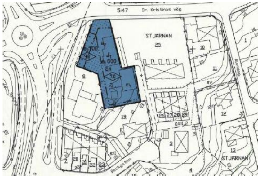
Detaljplan för fastigheten Stjärnan 24.