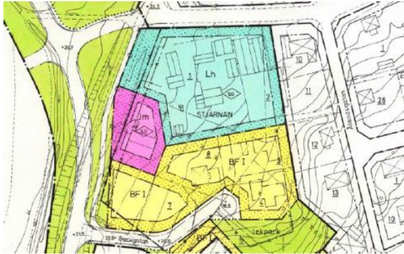
Stadsplan för del av kv Stjärnan, kv Stormhatten och del av Tälje 4:60.