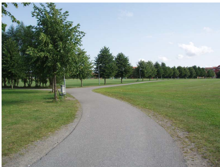
GC- väg genom området

Kommunstyrelsens arbetsutskott gav 2006-05-04 § 131 dåvarande stadsarkitektkontoret i uppdrag att påbörja ändringen av detaljplanen från allmänplats mark till idrottsändamål.