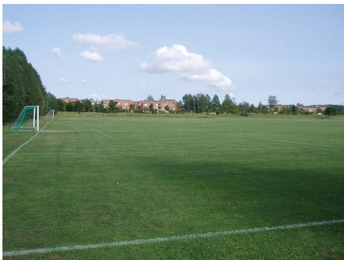
Vy över aktuell placering av konstgräsplan

Bygglov kommer att krävas för uppförande av belysningsstolpar för att bevaka de närboendes intressen. Belysningsstolparna bör inte stå på när fotbollsplanen inte används.