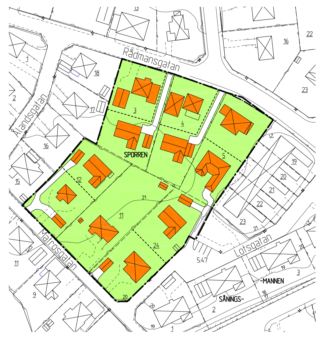
ILLUSTRATIONSPLAN Skala 1:1000/A1