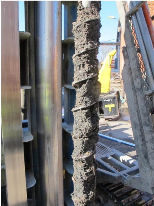
Bild 4C: BMP18 1-2 m Provtagning av sandig, grusig fyllning 1,0-2,0 m. Lagret innehöll enstaka bitar av glas och luktade svagt, möjligen av PAH.