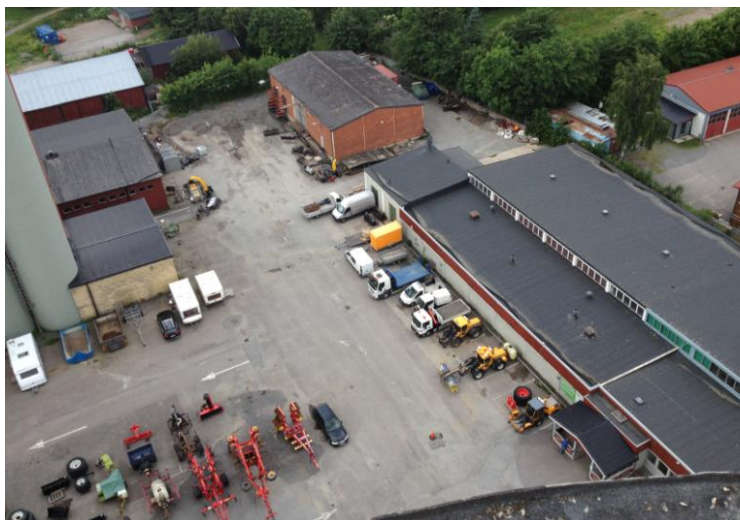
Norrtälje hamn Lantmännen och Pråmen 1

Delområde 4 Brännäset 8 och 16 samt Pråmen 1 Norrtälje kommun