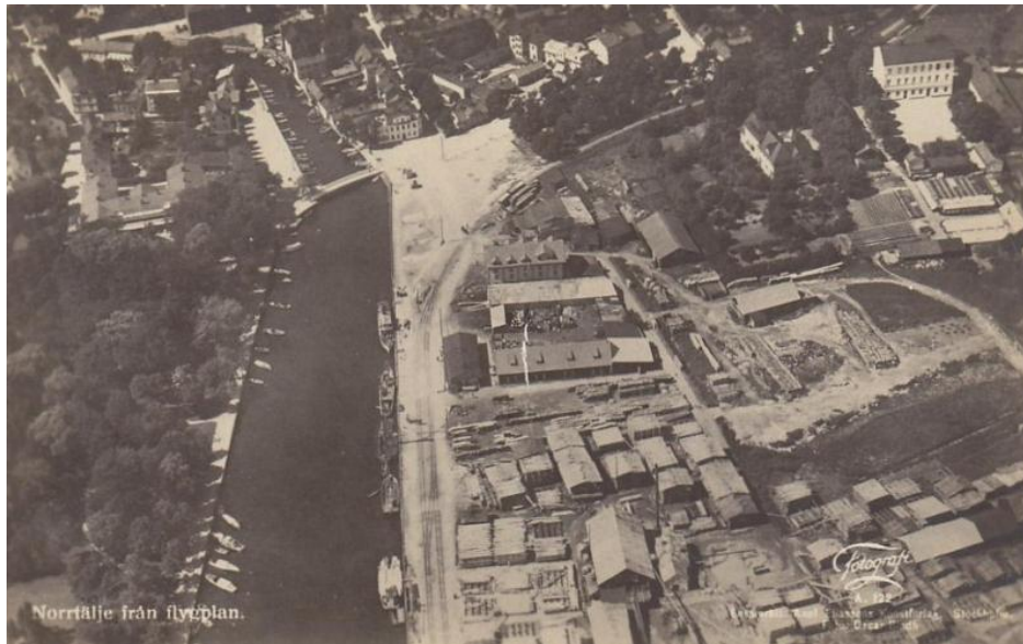
Bild 1: Historisk flygbild över hamnen och järnvägsspåret, 1927.