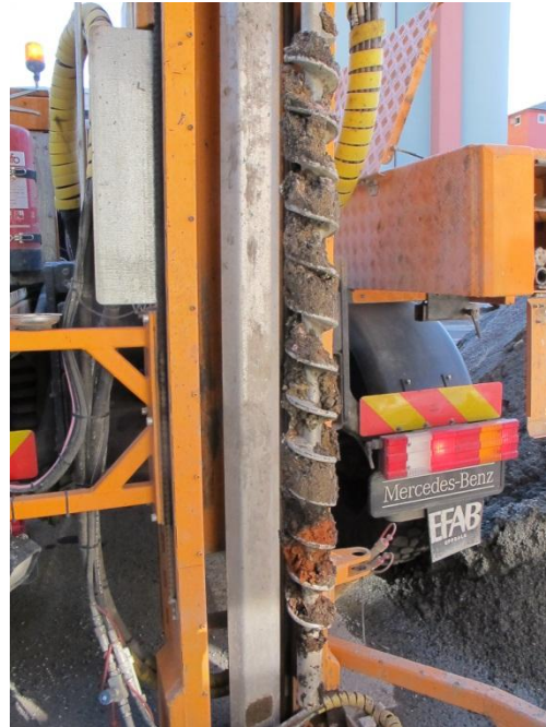
Bild 4D: BMP20, 0-1 m Provtagning av grusig, sandig fyllning med inslag av tegel och lera mot djupet. Lagret innehöll dessutom lite bark och en metalltråd.