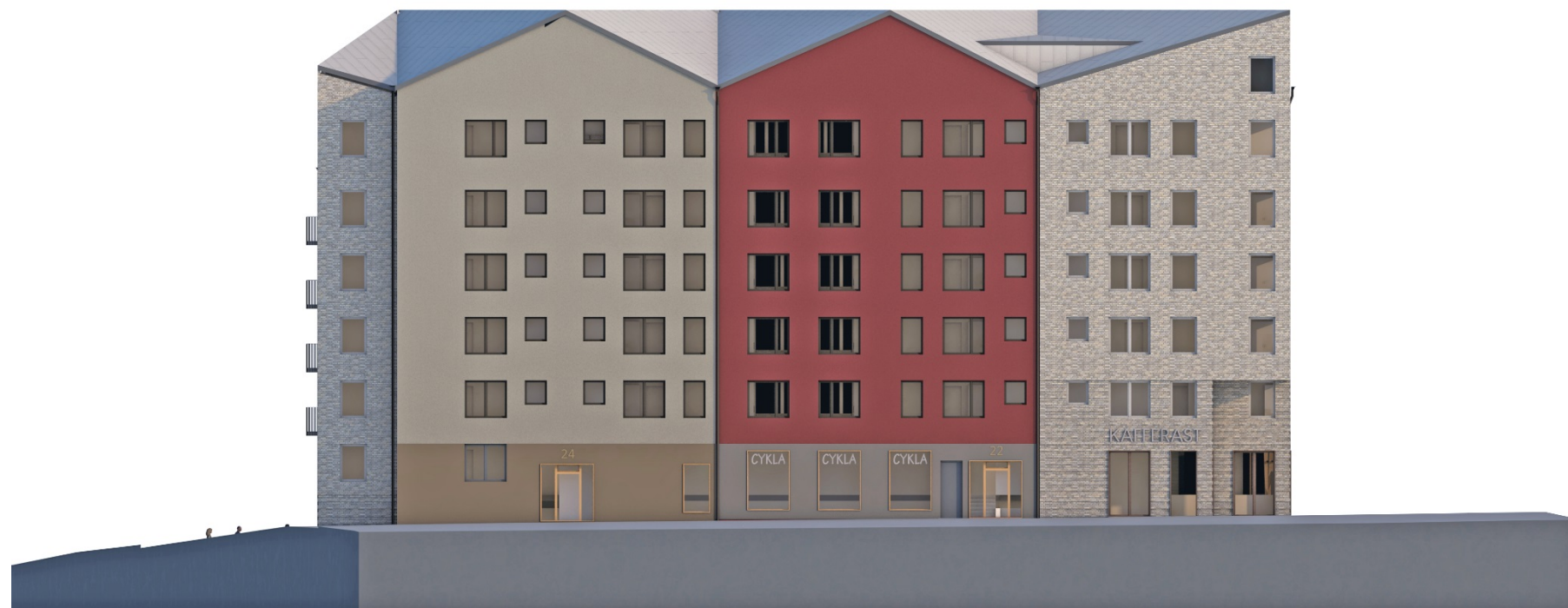
Kvarteret mot Östra Rögårdsgatan i norr.