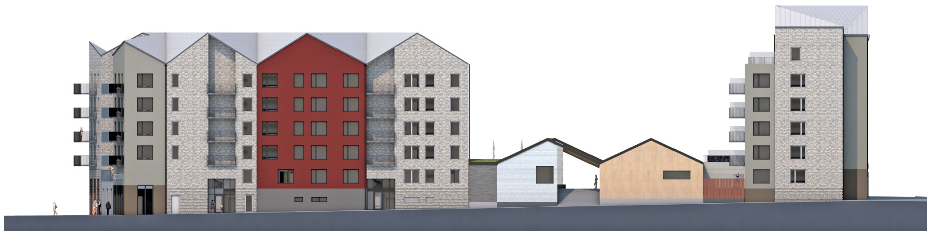
Kvarteret mot Skutgatan i öster.