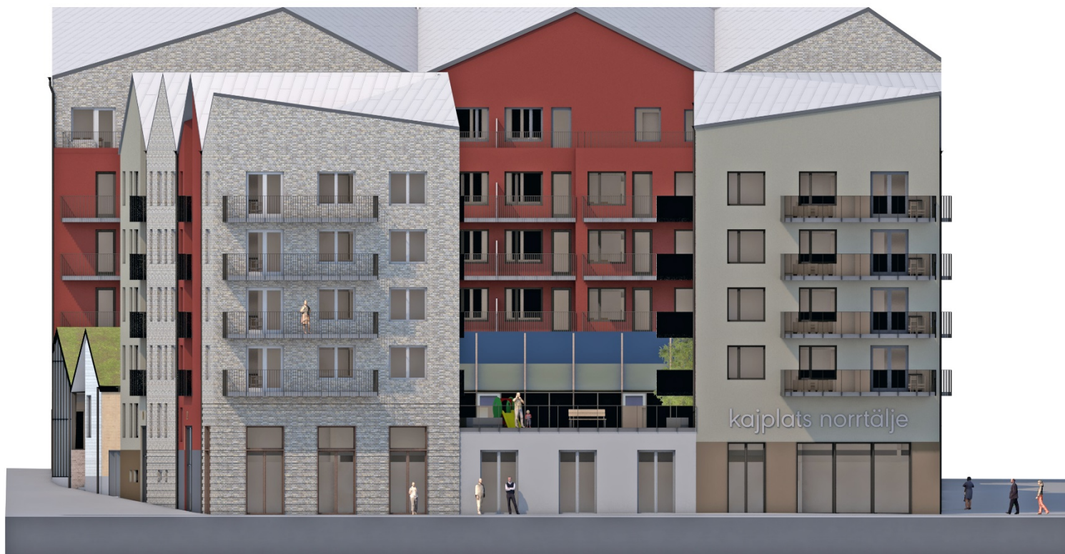
Kvarteret mot kajen i söder.