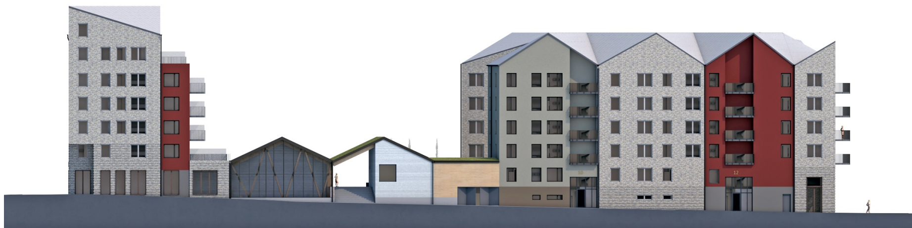
Kvarteret mot Sjöfartsgatan i väster.