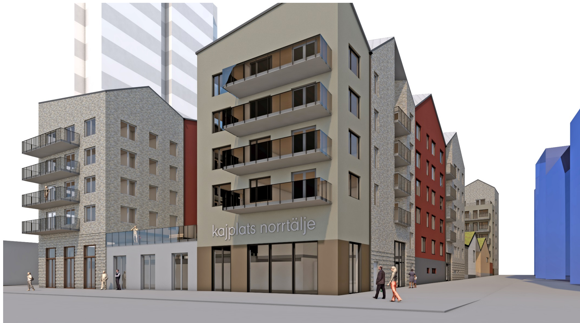
Illustration sedd från kajen. Skutgatan till höger och Havstornet i bakgrunden.