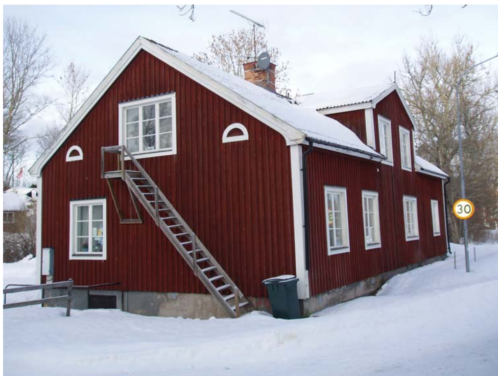
Den gamla skolbyggnaden

Befintlig byggnad har tidigare varit ianspråktagen för kontorsändamål, men står numera tom. Den intressent som har för avsikt att köpa fastigheten kommer att bedriva byggnaden som ett vandrarhem och som komplement till den hotellverksamhet som idag bedrivs i Häverödal (Langers hotell).