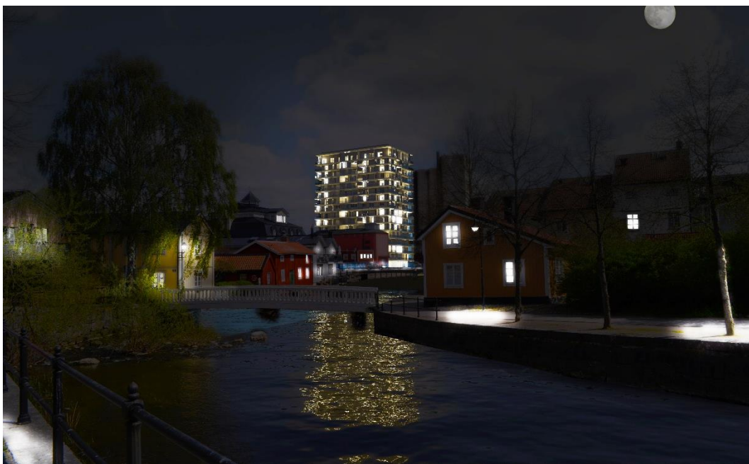
Volymstudier sett från centrum, dag- och nattbild. Brunnberg & Forshed Arkitektkontor AB.