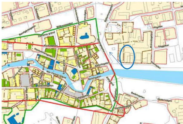
Riksintresseområdet Norrtälje stad markerat med grön linje. Blå ring markerar planområdets läge. Illustration från planbeskrivning för Brännaset, s. 18

Kulturmiljöenheten vid Länsstyrelsen i Stockholms län är den myndighet som bevakar att miljöbalken efterlevs med avseende på riksintressen för kulturmiljövården enligt 3 kap. 6 § Miljöbalken (MB). I länsstyrelsens samrådsyttrande konstateras att risk för negativ inverkan på riksintresset föreligger då lokalhistoriska värden och betydelsebärande landmärken för hamnstaden Norrtälje försvinner i och med rivning av silobyggnaderna, vilket försämrar förståelsen för stadens historia som hamnstad. Gestaltning av den föreslagna höga ersättningsbyggnaden bedömdes sakna koppling till platsens ursprung och historiska referenser i form av taksiluett, fasaduppdelning och material som efterlyses för att öka förståelsen för områdets historia.