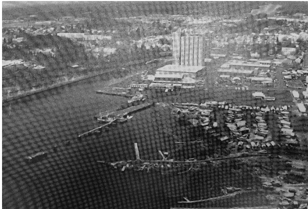
Utsikt mot hamnen från öst på 1990-talet. Jansson, Gösta & Jansson, Lennart