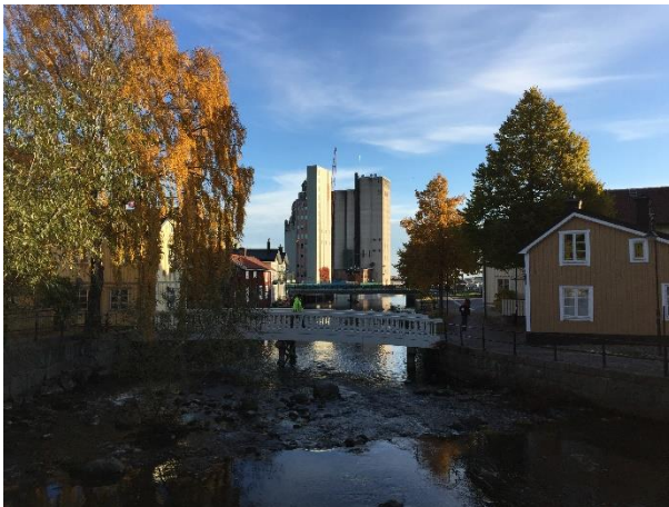
Hamnen med de två höga silorna sett från väst.