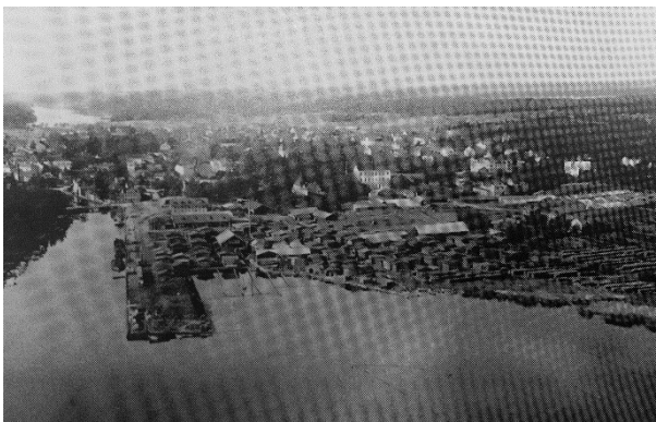
Utsikt mot hamnen från öst kring 1900 före silornas byggande. Jansson, Gösta & Jansson, Lennart