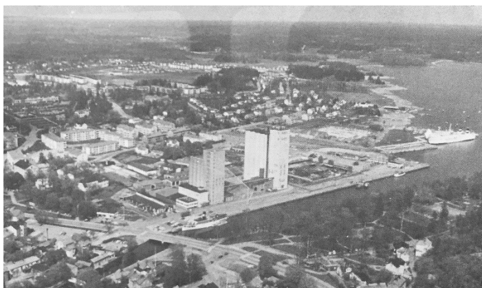
Flygfoto med hamnen sett från sydväst, troligen 1970-tal. Jansson, Gösta

De tre silobyggnaderna visade utvecklingen både i utformningen av silor och i omfattningen av spannmålshanteringen i hamnen. Samtliga silor hade därmed ett lokalhistoriskt, industrihistoriskt och ett byggnadsteknikhistoriskt värde. 17 De berättade om Norrtäljes betydelse för den omkringliggande landsbygden under en stor del av 1900-talet. Byggnaderna fungerade som ett landmärke invid vattenspegeln och var väl synliga i stadslandskapet, såväl från staden som från vattnet sett. Tillsammans hade de ett