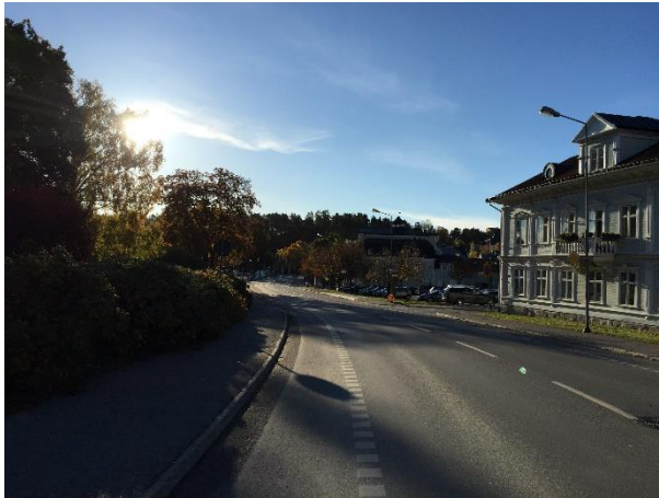
Roslagsvägen åt syd. Hamnen till vänster i bild och riksintresset stadskärnan till höger.