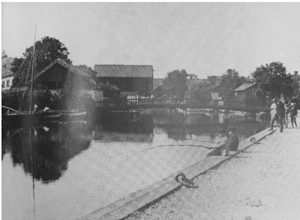
Utsikt från hamnen västerut. I bakgrunden societetsbron som numera är flyttad. Jansson, Lennart