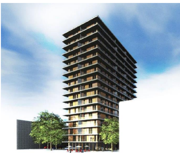
Idéskiss för gestaltning av flebostadshus, Brunnberg & Forshed Arkitektkontor AB, från planbeskrivning för Brännaset, s.29