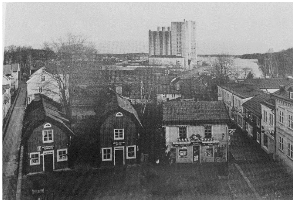
Utsikt mot hamnen över Lilla torg, där hamnen låg från början. Jansson, Gösta & Jansson, Lennart

last- och passagerartrafik. Kring sekelskiftet 1900 var stadens huvudsakliga näring sjöfart med 21 segelfartyg och 3 ångfartyg. 9