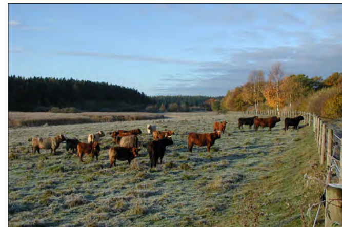
Salmunge sjöäng restaurerades genom avverkning av träd och buskar, fräsning av vass, stängsling och bete.

Framsidan av broschyren visar Carlbergs slåtteräng i Fasterna socken och Libbersmora ekbacke i Rimbo socken, två områden som tidigare var igenväxta men som nu har restaurerats till ängar som sköts med slåtter och höbärgning. De båda slåtterängarna har ett särskilt rikt växt- och djurliv. Norrtälje kommun har medverkat till att totalt 200 hektar naturbetesmarker och slåtterängar har restaurerats och nu sköts så att natur- och kulturvärdena bevaras.