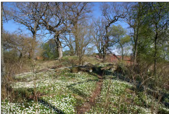
Vitsippstider i Lunden i Vigelsjö naturreservat, omedelbart väster om Norrtälje stad.

I flera tätortsnära områden bedriver Norrtälje kommun skötsel för att förbättra för friluftslivet och för att gynna växt- och djurlivet.