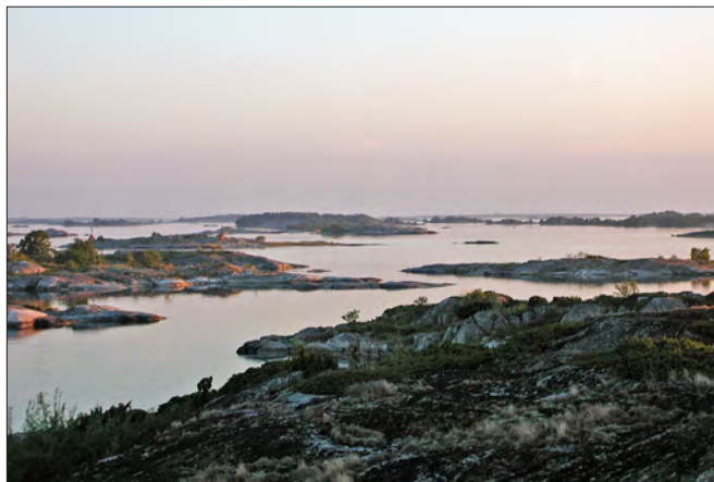
I Söderarms skärgård finns ögrupperna Runö, Bränd-Hallskär och Kläppen, alla ägda av kommunen och med höga naturvärden.

I kommunen finns även Ängsö nationalpark. Den är Sveriges första och inrättades 1909. Ängsö består av ett bevarat odlingslandskap från 1800-talet. Nationalparken har ett stort kulturhistoriskt värde och uppvisar även en stor blomsterprakt och ett rikt fågelliv.