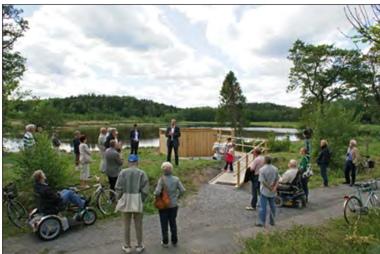
Den 15 juni 2007 invigdes den lättanvända utsiktsplatsen vid sjön Ludden, strax norr om Norrtälje stad.