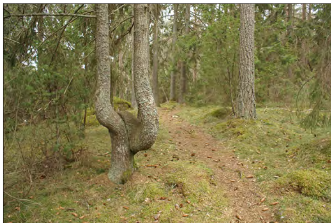
I Oxnäsets naturreservat på Rådmansö finns en stig som går genom den gamla barrskogen ner till klipporna vid havet.