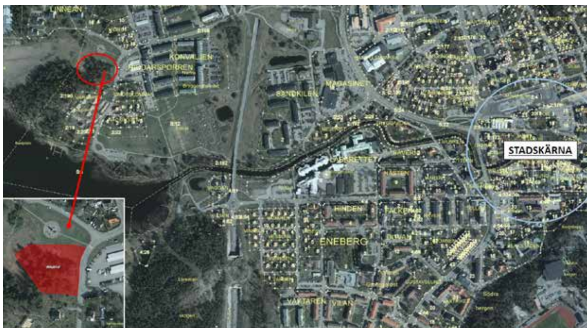
FLYGFOTO ÖVER NORRTÄLJE TÄRTORT MED TÄVLINGSOMRÅDET MARKERAT MED RÖD CIRKEL.

Närområdet består av flerbostadshus och småhusbebyggelse med närhet till Vigelsjögård, Lommarbadet och Vigelsjö naturreservat. Grundskolan Lommarskolan ligger endast några hundra meter ifrån den blivande fastigheten.