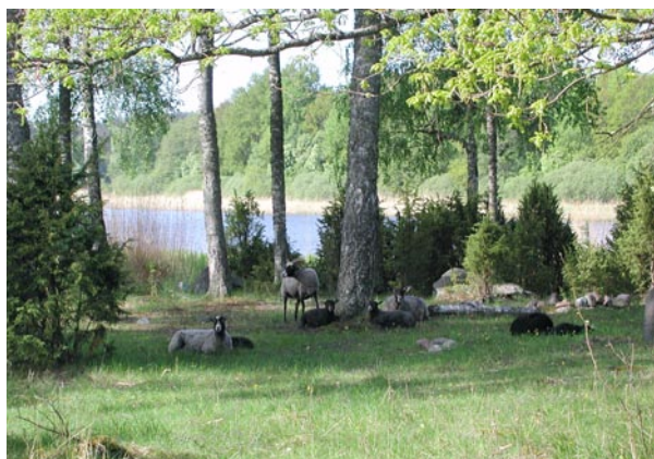
Får betar i Sjöhagen vid Lommaren.

Reservatet som är 69 ha stort inrättades 1998 av Norrtälje kommun med främsta syftet att skydda värdefull tätortsnära natur för rekreationsändamål.