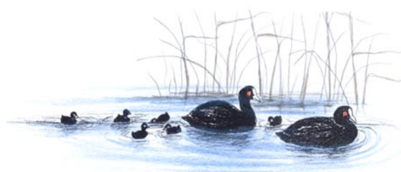
Sothöns med ungar

Det område där Vigelsjö naturreservat ligger är i hög grad präglat av det sprickdalslandskap som sträcker sig genom Uppland och Sörmland. I berggrunden finns sprickor som delvis är vattenfyllda och då bildar sjöar. Lommaren är ett exempel på en sådan sjö där vikarna markerar sprickorna i berggrunden. Berggrunden utgörs av graniter och granodioriter i söder och metavulkaniter i norr och de dominerande jordarterna är morän och i de lägre delarna lera. I området kan kalkstenar med fosil som inlandsisen burit med sig påträffas.