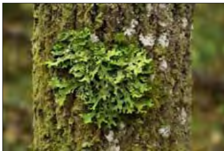
Lunglav förekommer rikligt i området.

Efter en lång period av lövdominans på udden skedde en betydande kolonisering av barrträd vid mitten av 1900-talet. Kolonisationen efterföljdes av igenväxning. Denna igenväxning verkade inte enbart negativt på naturvärdena i området. Generellt fick skogslevande arter möjlighet att vandra in samtidigt som betes- och slåttergynnande arter lyckades hålla sig kvar, vilket ökade artrikedomen. På lång sikt leder dock igenväxning till att arter kommer att försvinna ifrån området.