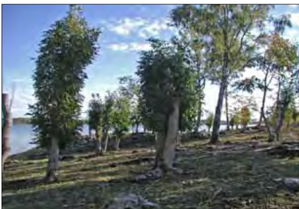
Restaurerad hagmark med hamlade träd vid Bagghusfjärden.

Aktiv skötsel är en förutsättning för att naturvärdena i reservatet ska bevaras. Skötseln i området utgår från att återskapa det äldre kulturlandskapet. Genom tidigare bruksformer som slåtter och bete samt hamling av lövträden har området återfått sin öppna karaktär.