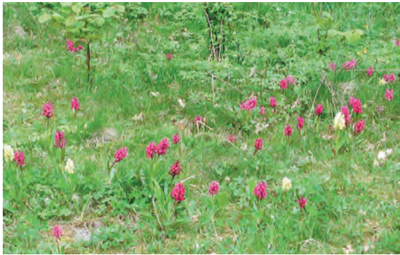
Orkidén Adam och Eva växer nära gårdesgården i väster.

Lindholmens naturreservat invigdes den 16 maj 1996 av riksdagens dåvarande talman Birgitta Dahl och är det första naturreservat som inrättats av Norrtälje kommun. Området har med sin rika flora och sitt rika fågelliv, lockat till sig många besökare och blivit ett populärt strövområde. Reservatet är på ca 4 ha och ligger strax öster om Norrtälje stad, bredvid reningsverket med samma namn. Området är en berg- och moränkulle bevuxen med lövträd, där de dominerande trädslagen är ek, asp och hassel.