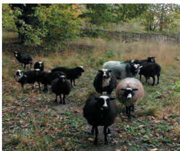
Roslagsfåren trivs på Lindholmen

Under 1900-talet har antal roslagsfår snabbt minskat. Om de inte hade bevarats på Raggårön hade de varit helt försvunna idag. Stiftelsen Norrtälje Naturvårdsfond startade år 1995 ett projekt för bevarande av roslagsfåret. Idag ser situationen för roslagsfåret bättre ut, tack vare Naturvårdsfondens engagemang samt föreningen Allmogefåret som arbetar med roslagsfåret och andra hotade fårraser av allmogeras.