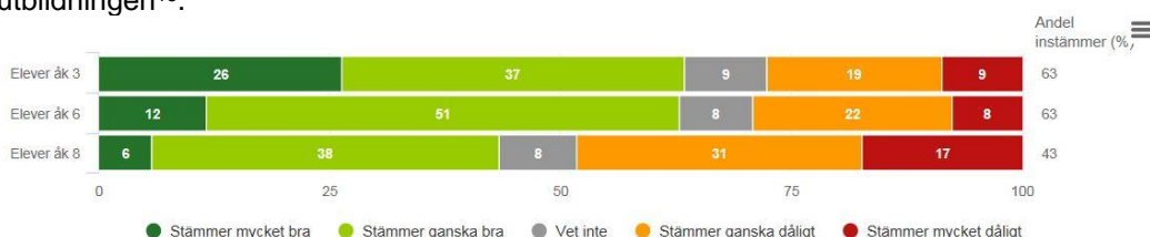
Figur 2. Andel elever som anger att de får vara med och bestämma hur de ska arbeta med olika skoluppgifter, Norrtälje kommunala skolor 2019.

De demokratiska principerna att kunna påverka, ta ansvar och vara delaktig ska omfatta alla elever. Elever ska ges inflytande över utbildningen. De ska fortlöpande stimuleras att ta aktiv del i arbetet med att vidareutveckla utbildningen och hållas informerade i frågor som rör dem. Informationen och formerna för elevernas inflytande ska anpassas efter deras ålder och mognad. Eleverna ska alltid ha möjlighet att ta initiativ till frågor som ska behandlas inom ramen för deras inflytande över utbildningen 13 .