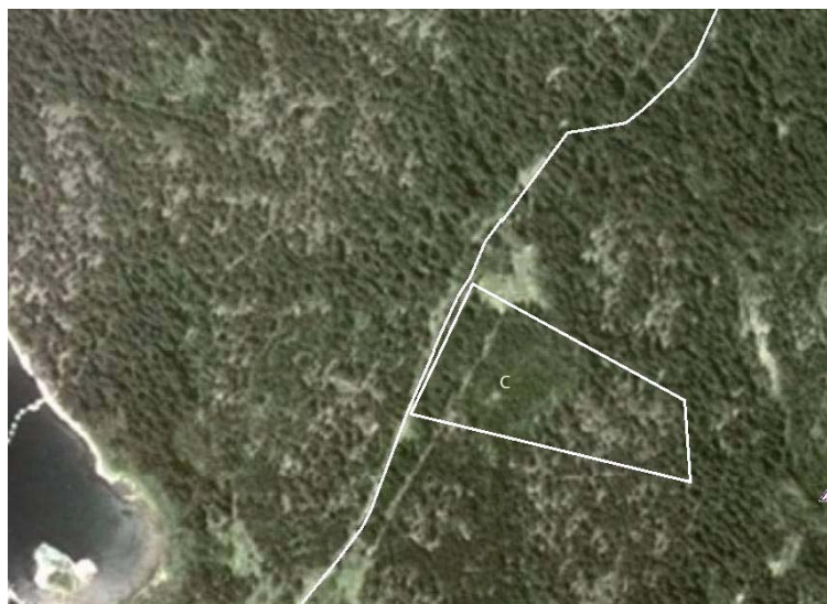
Område C i översiktsplanen

Område C ligger intill vägen norrut i tät barrskog och gränsar till försvarets tomt där man tippat sprängsten från norra ön. Marken är plan intill vägen och reser sig längre in från ca + 5 meter till + 12. Nära intill ligger Alfredsvikens gästhamn och badplats.