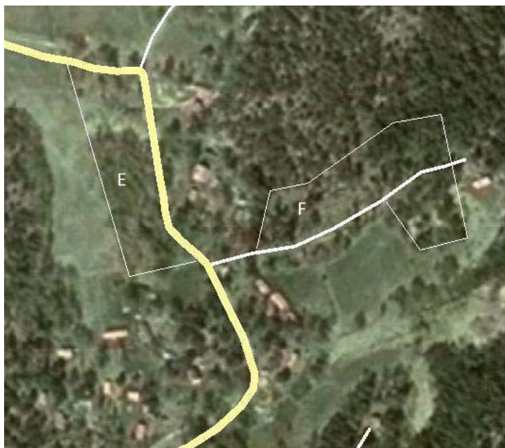
Område E och F i översiktsplanen

Område F ligger öster om byvägen intill en mindre men körbar tvärväg. Tomten med barrträd sluttar svagt ner mot söder och "Norrvreten" som är öppen gammal odlingsmark.